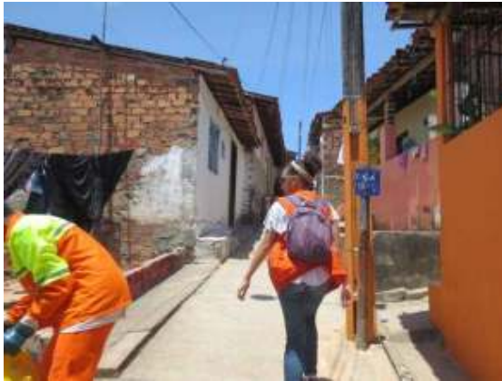
Figura 03

Nas informações socioeconômicas foram inseridos dados referentes à pessoa entrevistada, como nome, idade, estado civil e grau de escolaridade, além de informações sobre a família, número de moradores e suas respectivas faixas etárias, renda familiar, tempo de moradia, etc.