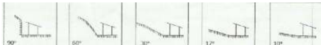
Figura 04

Uma figura (Figura xx) foi inserida no boletim com o fim de auxiliar o cadastrador quanto à inclinação da encosta observada, a mesma sendo importada do boletim do IPT.