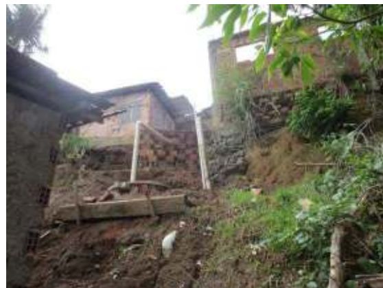
Figura 02

Apesar das importantes ações executadas pela Defesa Civil de Maceió-AL (COMDEC) o Mutange ainda encontra-se densamente povoado nas chamadas "grotas" onde encontram-se: assentamentos em áreas de risco geológico como encostas íngremes, histórico de escorregamentos de solo, escassez em sistema de drenagem e esgotamento sanitário, causando grandes prejuízos materiais registrados pela Defesa Civil. Diante dessa realidade o registro das informações no Cadastro Territorial Multifinalitário (CTM) através do preenchimento dos boletins de campo por regiões pré-definidas fornecerá suporte aos órgãos de gerenciamento na tomada de decisões, por meio da Integração de informação territorial, social, econômica, jurídica, ambiental entre outros.