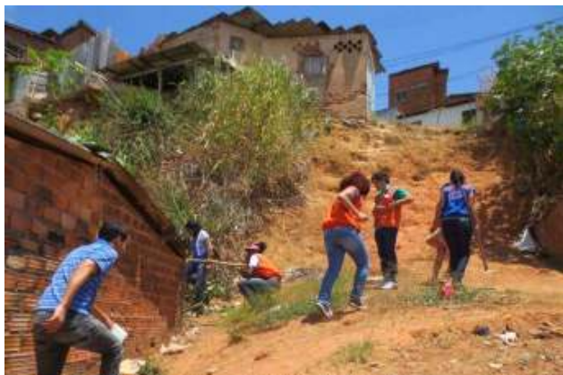
Figura 01